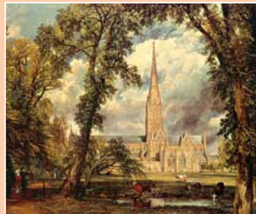
John Constable La cathédrale de Salisbury, 1827 Albert and Victoria Museum, Londres