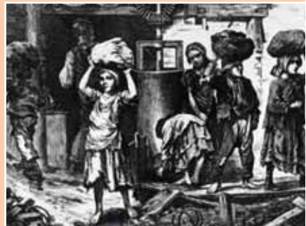
La Warren's Blaking (l'usine à cirage)

A Londres, Marx publie Le Manifeste du parti communiste en 1848.