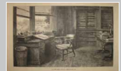
Luke Fildes, la chaise vide (the empty chair)

Van Gogh dessinait souvent des chaises sur lesquels des objets personnels incarnaient ceux qui les occupaient. La chaise de Gauguin est un hommage rendu par Van Gogh à son ami le peintre.