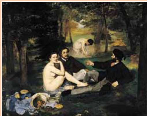
Edouard Manet Déjeuner sur l'herbe, 1863 Musée d'Orsay, Paris

LITTÉRATURE John Keats (1795-1821) Lord Byron (1788-1824)