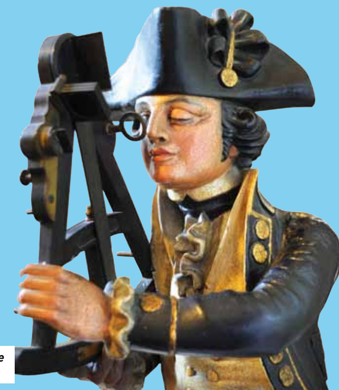
Enseigne de magasin de matériel de marine