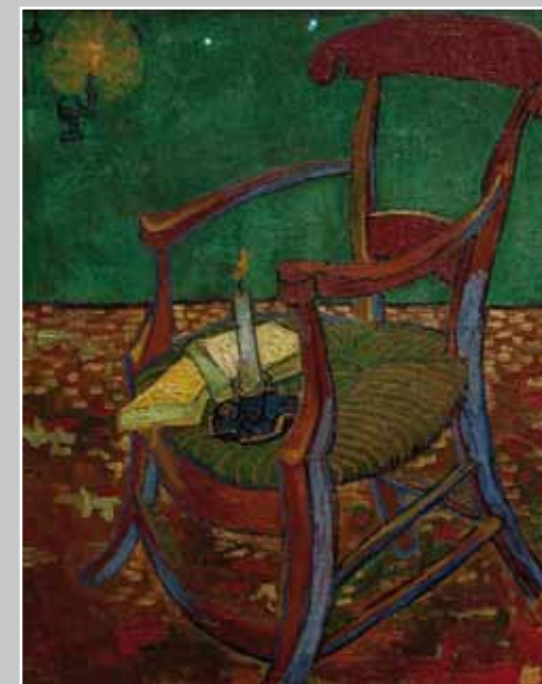
Vincent Van Gogh, La chaise de Gauguin 1888, Musée Van Gogh, Arles

Le peintre impressionniste Vincent Van Gogh (1853-1890) s'est inspiré d'une gravure réalisée par le peintre Samuel Luke Fildes (1844-1927) parue dans la revue Graphic à l'occasion de la mort de Charles Dickens. Cette gravure représente la chaise vide dans la chambre où l'écrivain est décédé.