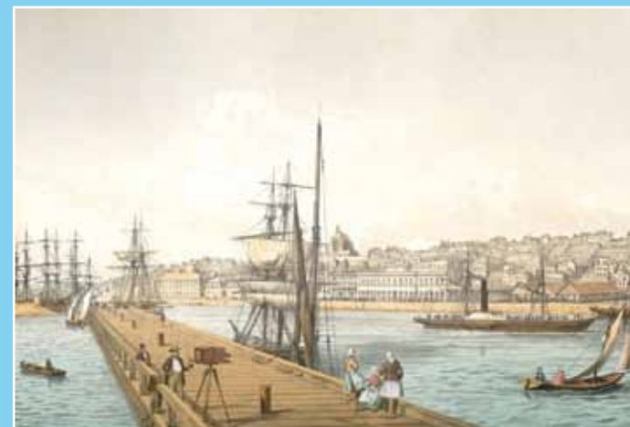
Le port de Boulogne au XIX e siècle

L'histoire liant Charles Dickens à la ville de Boulogne commence en 1844, lorsqu'il y fait escale avec sa famille lors d'un périple vers l'Italie. Il y passe des vacances sur le conseil de son médecin en 1853, et élit domicile au Château des Moulineaux, rue Beaurepaire, à l'emplacement de l'actuel Lycée Mariette. Dickens évoque la vie bouloonnaise et ses spectacles dans un article paru dans Household Words , intitulé «Notre station balnéaire française». En 1854, il commente la fièvre locale liée à l'alliance entre la France et l'Angleterre dans le cadre de la guerre de Crimée : le camp militaire du Honvault, entre Boulogne et Wimereux, se trouve non loin de la demeure de Dickens. En 1856, la famille Dickens revient passer un troisième et dernier été à Boulogne, durant lequel il rédige le conte «The Wreck of the Golden Mary», publié en décembre dans Household Words . Mais l'épidémie de choléra de 1854 puis celle de diphtérie de 1856 ont raison de son attachement à Boulogne.