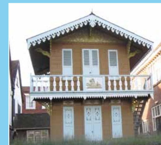
Le chalet de Rochester

À Condette, Dickens bénéficie régulièrement de l'hospitalité de Ferdinand Beaucourt, riche commerçant bouloonnaise que l'écrivain évoque dans Le Bagage de Quelqu'un publié en 1862. La rumeur prétend que Dickens y invite sa maîtresse Ellen Ternan, dans ce qui est devenu aujourd'hui le « Chalet Dickens ». L'anecdote est entretenue par le journal satirique Punch à partir de 1902, avec la révélation de multiples témoignages de la présence de Dickens dans les années 1860. Les habitants évoquent ainsi les petits cadeaux laissés par l'écrivain, et le maire de l'époque, M. Huret-Lagache, relate ses conversations avec lui. Par contre, nulle trace de la venue de la jeune actrice. Aujourd'hui, un médaillon à l'extérieur du bâtiment signale la venue de Dickens.