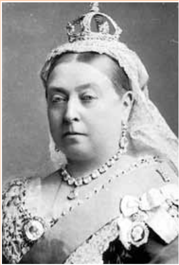
La reine Victoria I ère

Le système anglais repose sur une monarchie constitutionnelle , ce qui signifie que les pouvoirs de la reine sont limités par une Constitution.